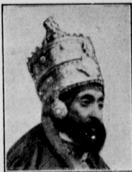
H.M. THE EMPEROR OF ETHIOPIA.

“The great Ethiopian nobles, as well as other persons in our country, are already convinced that to have slaves in their house is a useless burden. This conviction will spread of itself and we shall encourage its spreading throughout our country by a sustained propaganda. As a result of the laws already existing and of those which we shall promulgate in due course, numerous slaves will obtain their freedom.