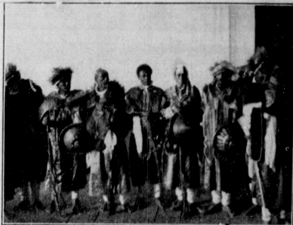
Guerriers éthiopiens dans l'ancien costume

Il serait ridicule de nier l'existence de l'esclavage en Ethiopie. La libération brusquée de ces pauvres gens serait sans doute pour la plupart d'entre eux un grand malheur : ils ne sauraient comment subvenir à leurs besoins. La libération doit être rationnelle pour ne pas être nuisible aux affranchis eux-mêmes. La situation des esclaves n'est d'ailleurs pas conforme à l'idée qu'on se fait en Europe. Fréquents sont les cas où des esclaves libérés reviennent à leur maître après avoir goûté pendant quelque temps d'une liberté famélique, et lui demandent de rentrer à son service. Ces remarques ne constituent point une défense en faveur de cette institution barbare. Le gouvernement éthiopien, à l'instar de ce qui se fait dans toutes les autres régions du monde où règne encore l'esclavage, lutte pour le supprimer. Il se heurte à tous ceux qui trouveraient un avantage à con-