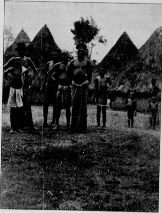
A VILLAGE IN THE SUO COUNTRY.

nectaries. A species of vanilla grows wild in the bush. There are many zingiberaceous plants in the undergrowth of the forest, sometimes with large and delicately coloured flowers, at others remarkable for the size and rich colouring of their leaves. Amongst these may be noted Costus , Amomum , Thalia , and Renealmia . Another family of plants well-represented in the undergrowth, and remarkable for the variety and beauty of their foliage, are the arums. Prominent amongst these are