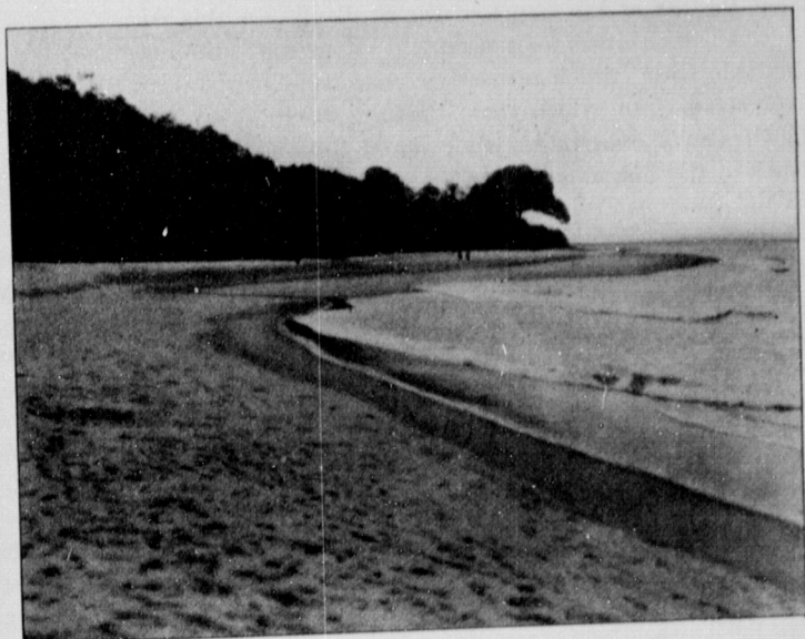
FOREST COMING DOWN TO SEA-SHORE.

only affect the Atlantic at some distance from the shore. But, of course, this portless condition adds very much to the discomfort of dealings with Liberia. Although the swell from the choppy surface raised by the wind may not be sufficiently serious to affect big vessels lying at anchor, it is not at all nice for small boats or steam-launches, and generally during the rainy season of the year transference from the big steamer to the shore-going boat has to be effected by means of a crane and a cradle. Still more to be dreaded on some points on the coast is the landing or the going off, on account of the surf. Perhaps the best approach to a sheltered harbour which exists is at the capital, Monrovia.