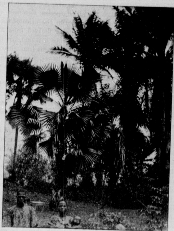
BORASSUS PALM AND OIL PALMS.

road-making, as it does not degenerate into mud. Very little is known about the possible mineral wealth of Liberia up to the present time, as the extremely dense forest of the interior is a great obstacle to a rapid survey of the country. Apart from hæmatite iron, which appears to exist nearly everywhere, there are traces of gold in the mud of the rivers, and native stories assert the existence of alluvial gold in the Mandingo uplands beyond the forest region. Lead has been discovered recently in the Kelipo country in eastern Liberia, and zinc ore in the