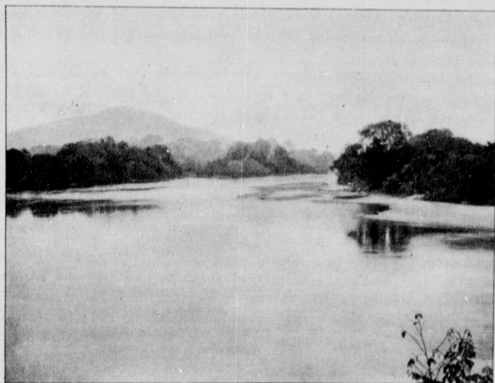
THE KAVALLI RIVER.

turned attention towards the same coast, and in 1821 and at subsequent dates settlements were effected, firstly at Monrovia, and later on at Roberts Port, Grand Basá, Sinó, and Harper (Cape Palmas). Usually those who conducted the enterprise went through the form of buying small plots of land from local headmen or chiefs; but, as a rule, the promoters of this movement did not trouble overmuch about the rights of the "bush niggers," as the indigenous natives were termed. Consequently, the first fifty years of the history of Liberia were marked by constant struggles between the Americo-Liberian invaders and the native blacks. During the last ten years, however, there has been a marked advance in