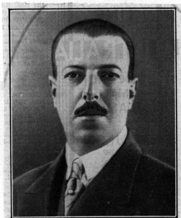
DR. JULIO PRESTES, President-Elect of Brazil. The revolutionaries assert that he is a "mere tool of the President," and seek to prevent his taking office.