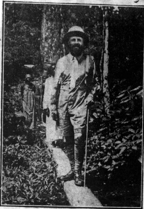
M. Franck en marche dans la forêt tropicale, lors d'un de ses voyages au Congo

Succombant à un infarctus cardiaque qui avait causé des troubles circulatoires très graves, M. Louis Franck, qui, atteint par la limite d'âge devait précisément prendre sa retraite comme gouverneur de la Banque Nationale, a brusquement terminé sa carrière.