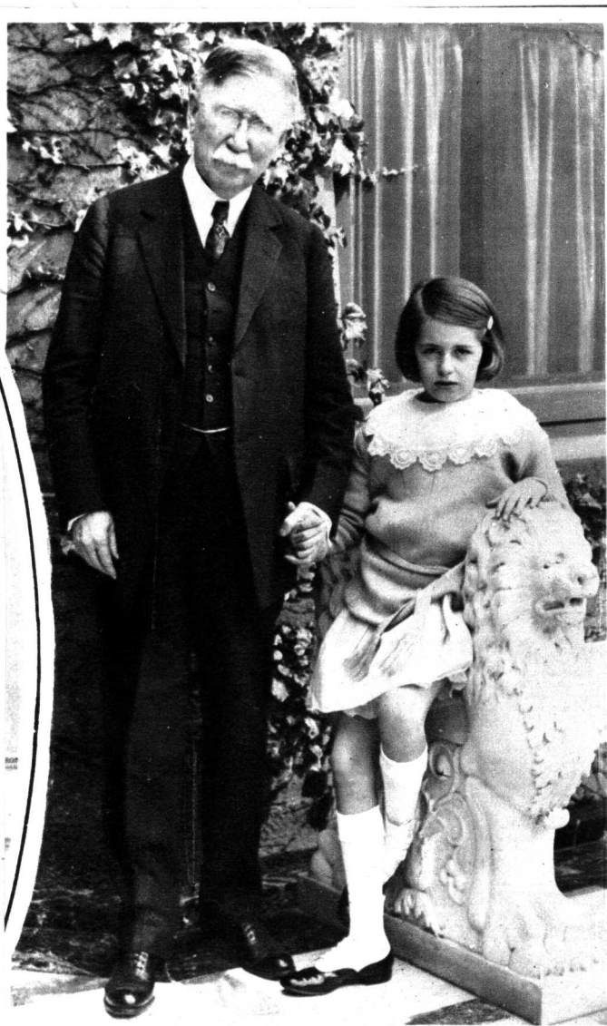
EDWARD L. DOHENY, THE OIL MAGNATE, WITH HIS GRANDDAUGHTER "DICKY- DELL," one of the richest children in the world and regarded by her grandfather as the most precious of all his possessions. An exclusive photo- graph.