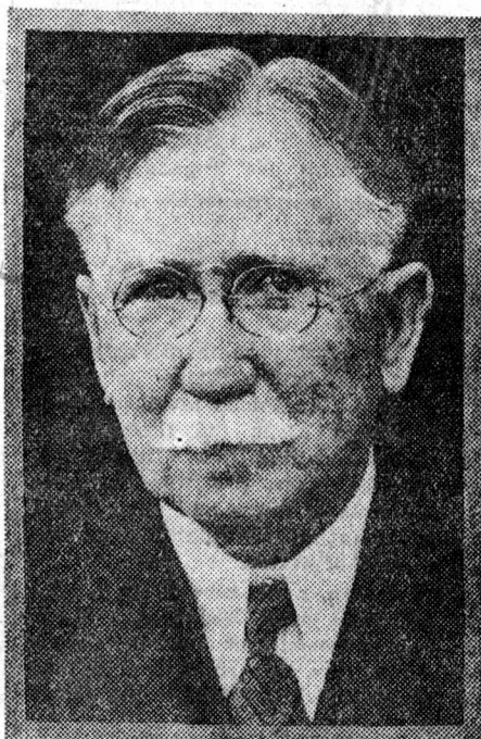
EDWARD L. DOHENY

Democrat, Indicted in Oil Scandal, Lured by Prosperity