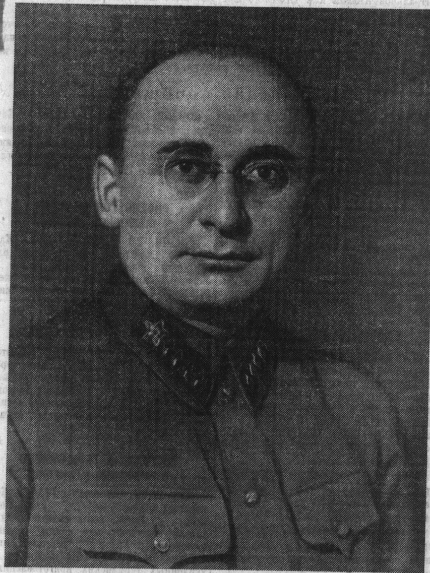
ЛАВРЕНТИЙ ПАВЛОВИЧ БЕРИЯ.