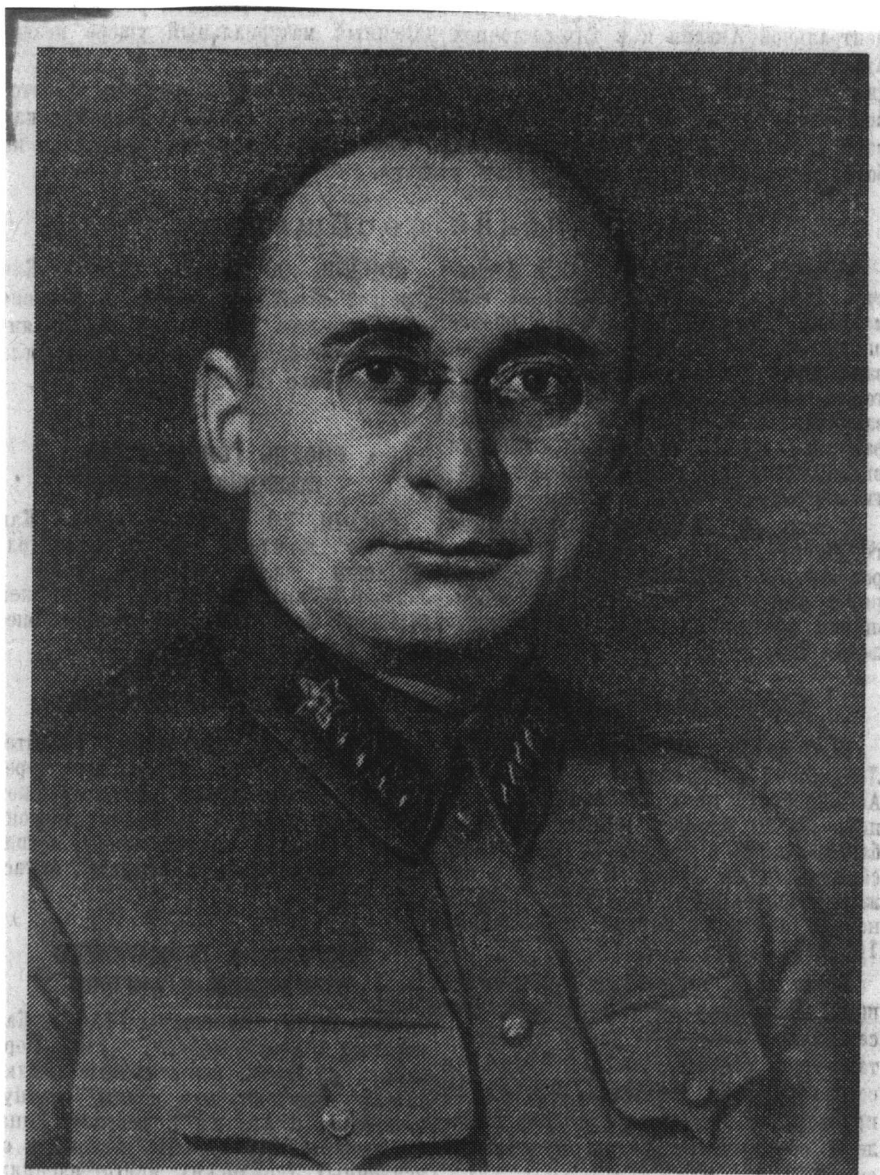
ЛАВРЕНТИЙ ПАВЛОВИЧ БЕРИЯ.